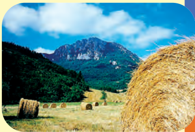
Le Pech de Bugarach

Son lac de 3 ha est un lieu de détente, où l'on peut également pratiquer la pêche.